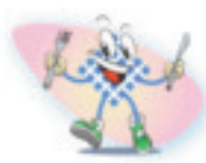
Déjeuner à la restauration scolaire