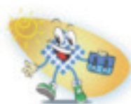
Accueil du matin

Lors de l'arrivée à l'école le matin la prestation choisie est sélectionnée en appuyant sur les touches/images.