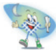
Accueil du soir/CLSH